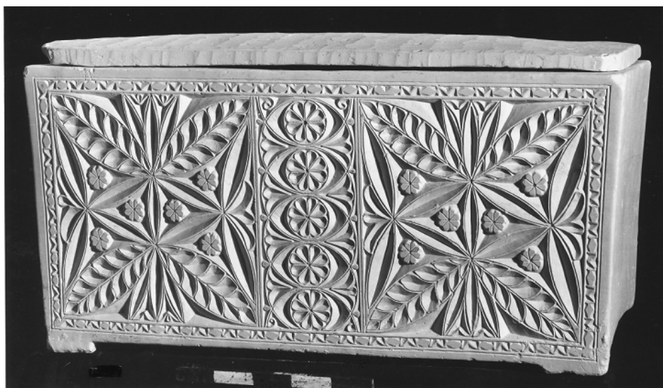
תמונה 2: הגלוסקמה המפוארת